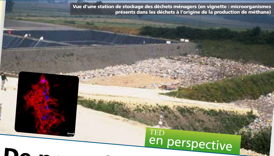
Vue d'une station de stockage des déchets ménagers (en vignette : microorganismes présents dans les déchets à l'origine de la production de méthane)