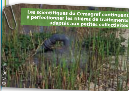
Les scientifiques du Cemagref continuent à perfectionner les filières de traitements adaptés aux petites collectivités

Aujourd'hui, plus de 2000 stations d'épuration par filtres plantés de roseaux fonctionnent en France.