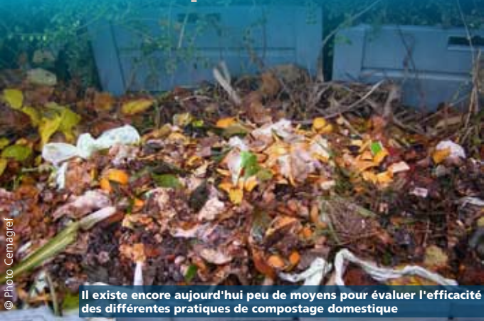
Il existe encore aujourd'hui peu de moyens pour évaluer l'efficacité des différentes pratiques de compostage domestique

L'agglomération rennaise favorise depuis plusieurs années la gestion domestique des déchets ménagers. Elle met particulièrement l'accent sur le compostage de proximité. Cependant, les motivations des citoyens pour engager une démarche de compostage ou la cesser sont encore très peu connues. Quant aux collectivités, elles disposent de peu d'informations précises sur les atouts d'une telle démarche. C'est ce à quoi veulent remédier les projets Eccoval et Miniwaste, fruits de l'union de partenaires régionaux et européens.